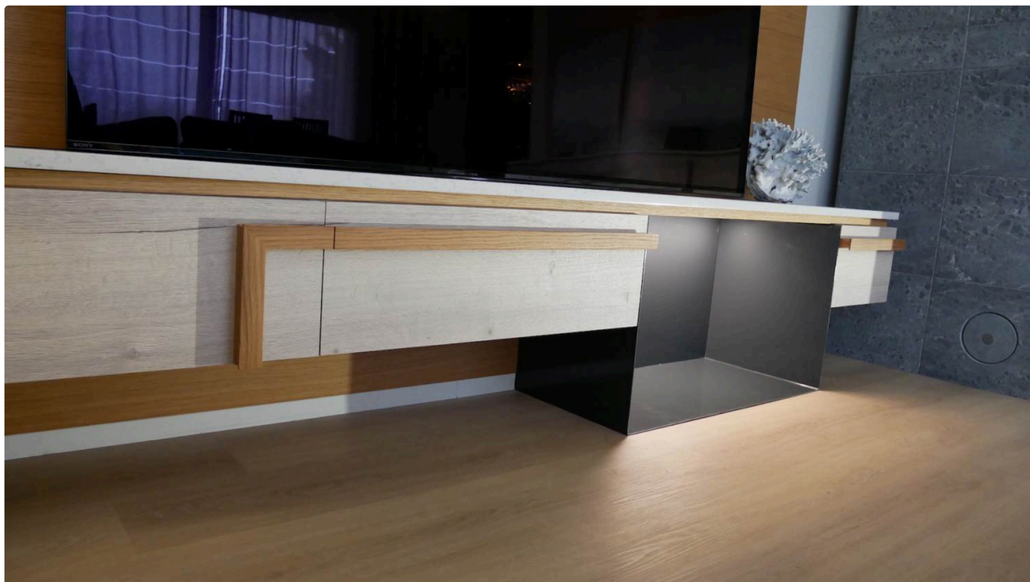
Tehtud tööd: Moderustik

Mööblisse on võimalik peita hubast meeleoluvalgust lisavad LED ribad.