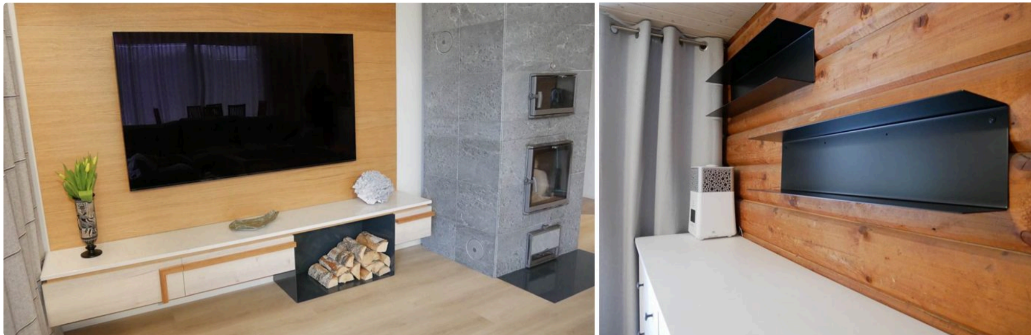
Fotot: Minimalistlik metall-puitmööbel (Moderustik)

Tänu metalli vastupidavatele omadustele on võimalik kujundada äärmiselt lakoonilise vormikeelega mööblit, mis sobitub maitsekalt nii modernsesse linnakoju kui ka arhailisesse maamajja.